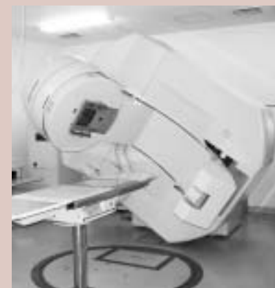
定位放射線治療装置「Cアームライナック」

ります。また、患者様を動かさずに三次元照射が可能(全立体の八七%の方向より照射可能)であり、安全かつ的確で治療範囲も広いので、大きな成果をあげています。