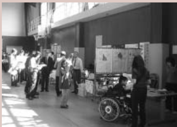
大学体育館を会場に開催

近年、不妊症の治療は大きく進歩しました。卵管性不妊や子宮内膜症の治療は、開腹手術から、腹腔鏡下手術に変わってきました。子宮筋腫の治療も開腹による核手術の他、腹腔鏡下、子宮鏡下手術、さらには子宮動脈塞栓術、収束超音波療法と多様化してきました。 体外受精や胚の凍結保存はもはや特殊な治療法ではありません。不妊症一般に広く用いられています。顕微授精は男性不妊に対する究極の治療法として、乏精子症や精子無力症だけでなく無精子症(約半数は精巣より精子回収可能)にも適用されています。体外受精や顕微授精の反復不成功例の取り扱いも重要な問題です。このような症例に対して、私どもは受精卵の卵管内移植を積極的にを行っています。 山王病院のリプロダクションセンターは、多様化した最先端の治療を患者様本