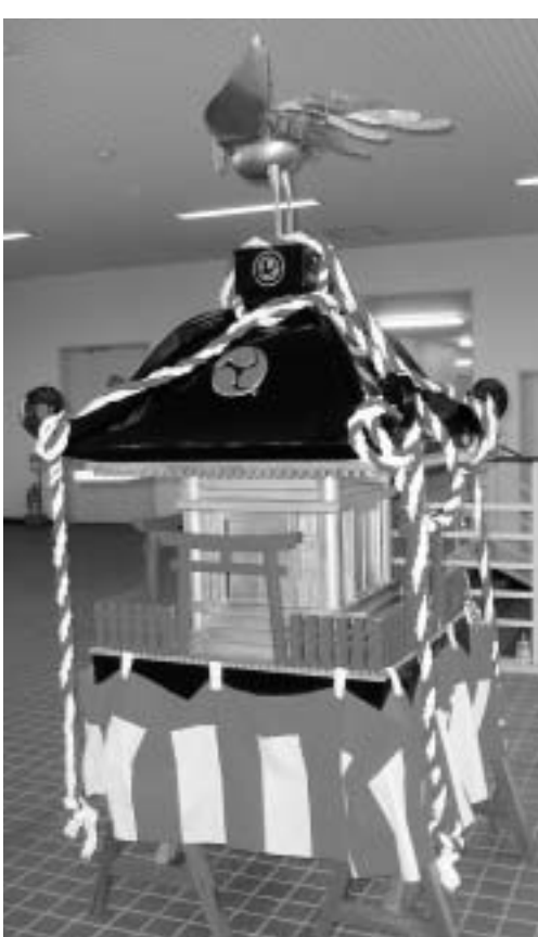
きれいに化粧直しの済んだ御神輿

でも器用さにかけてはナンバーワンです。御神輿補修作業の最初はぼろぼろになった表面をきれいにするところから始まりました。実習生にインターネットで御神輿の色と飾りを決める資料を出してもらい、ペンキと飾り紐、鳳凰などを購入してよいよ飾り付けが始まりました。療護園の入所者、デイサービスに通所者、ボランティア、実習生、職員総出でひびの補修、ペンキ塗り、飾り紐編みと組み方、飾り金具の取り付け、そして鳳凰の取り付けと約三カ月間の共同作業が行われました。その間シンナーの臭いに悩まされ、飾り紐の編み方に四苦八苦し、学祭までの期限を気にしながらやっと出来上がりです。