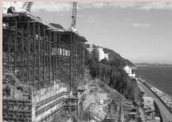
平成17年7月オープンを目指し順調に工事が進む