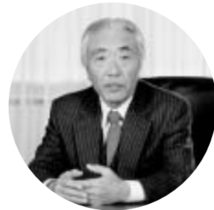
プロフィール 千葉大学医学部卒、医学博士。厚生省(現厚生労働省)保健医療局長、健康政策局長を歴任。在任中は、医療制度、医療保険、介護保険、医療の人材育成、医療制度改革など主として医療政策にかかわる。

整理してみると、カタカナ語は非常に多く、われわれが多くの言葉を安易に使っていたことを改めて思い知らされた。シルバーム(老人ホーム)、デイケア、デイサービス、フェニックス計画(こみの再生利用施設整備計画)等々あげればキリがない。これらの中には、今日では日本語として定着したものもあるが、どうしても訳せない言葉に、「ノーマライゼーション」があった。北欧で始まった健常者と障害者との共存する地域社会を目指す理念で、日本の社会にはなかった概念だけに、大臣好みの簡潔で短い表現が思いつかない。さすがの小泉さんも折れて、この言葉だけは注釈をつけて使うことでの了承を得