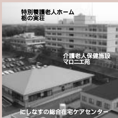
特別養護老人ホーム柘の実荘

柘の実荘は、柘木県内四十五番目の特別養護老人ホームとして平成六年七月に開設されました。敷地面積二、七三三平方メートルの、豊かな自然に囲まれた環境で、特別養護老人ホーム(定員五二名)・ショートステイ事業(定員一〇名)・老人デイサービスセンター(定員三〇名)・ホームヘルプサービス(支援費制度含む)・在宅介護支援センター(居宅介護支援)の五事業を実施しています。 施設では天然の温泉を利用しているため入所者・利用者の方々に大変喜ばれています。また、併設されている「国際医療福祉病院」・「介護老人保健施設マロ二工苑」と常に連携体制を取りながら、医療・保健・福祉の充実を図っています。 また、国際医療福祉大学の学生をはじめとする各種ボランティアの受け入れや、実習施設としての役割も十分に発揮しています。(国際医療福祉病院 福田明宏)