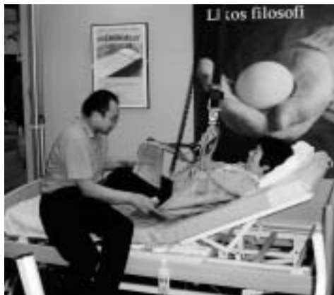
展示ブースでは福祉用具を使用してみることもできる