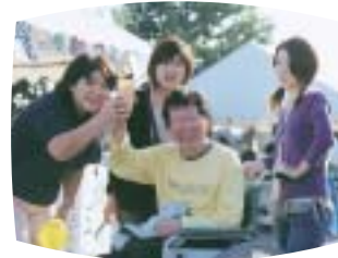
第8回「風花祭」の様子が放送

国際医療福祉大学で行われた催しの紹介を中心にお届けする国際医療福祉大学アワー! 体育祭や文化祭、公開講座に学科紹介と、これを見れば、国際医療福祉大学の毎月の様子が分かります。また、大学周辺の見所を、楽しい映像やインタビューを交えて紹介するコーナーもあり、充実した内容で好評放送中! 是非ご覧ください。