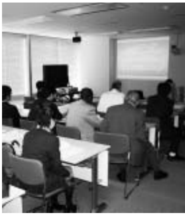
英語も交えて活発な討論が行われた

大田原本校での特徴としては、留学生の発表が行われたことを挙げる事ができるだろう。留学生の発表の際は、日本語だけでなく英語も交えて活発な討論が行われた。もちろん、留学生以外の発表に際しても、かなり積極的な討論が行われた。なお教室は二つで、それぞれ二十名程度が参加していた。(大学院 田中繁)