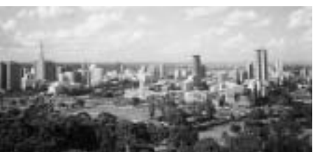
ナイロビ中心街2003年

このとき、JICA現地事務所担当者から強く指示されたことは、市内を絶対に一人で歩くな。移動は必ず車で、ということであった。ナイロビ人口一八〇万のうち約半数がスラムに住み、強盗が頻発、カージャックも毎日数件発生するので、車での移動も必ずしも安全とはいえない治安の悪化。かつて私が地上の楽園と思ったナイロビは幻と消えていた。