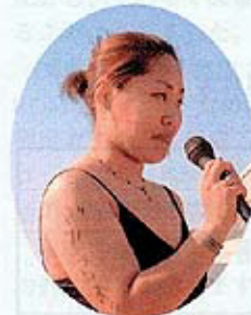
涙、涙、涙の大会委員長