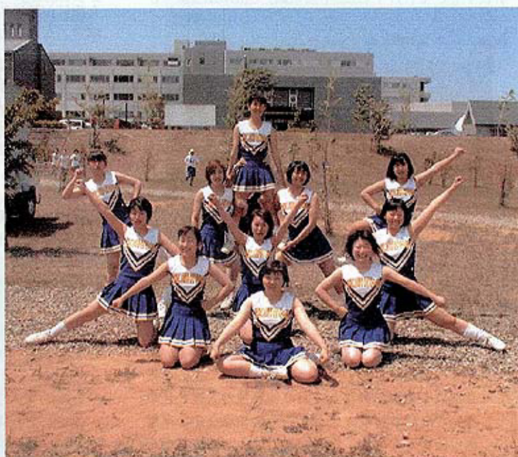
デビュー！ チアリーディング部 Panthers