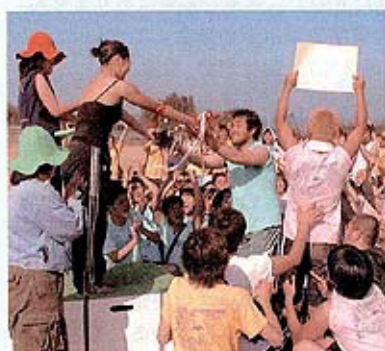
たたかい奪った優勝杯

発行：学校法人国際医療福祉大学 編集：広報委員会 TEL 0287-24-3000 内線7127 ホームページアドレス http://www.iuhw.ac.jp