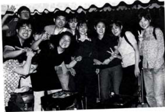
看護学科で行われた「豚汁会」6/10(水)