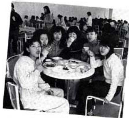
ランチタイムの新1年生 カフェテリア2F 4月下旬頃