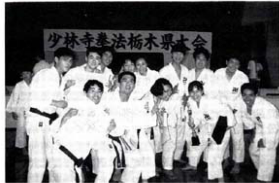
少林寺拳法創始50周年記念国際大会出場決定!! 9月13日 日本武道館にて