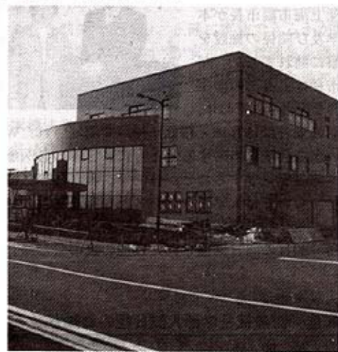
建設中の国際医療福祉大学クリニック