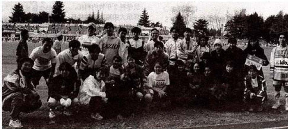
大田原マラソン出場者（大田原市の行事に大学として積極的に参加。約30名。）

発行：学校法人国際医療福祉大学 編集：広報委員会 TEL 0287-24-3000 内線7115