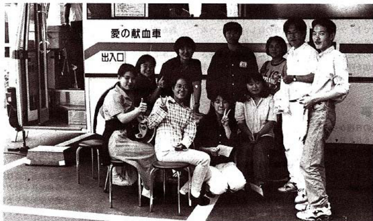
愛の献血 (本文記事2ページ)

発行：学校法人国際医療福祉大学 編集：広報委員会 TEL 0287-24-3000 内線7111