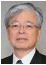
中村 秀一 教授

東京大学法学部卒業。1973年厚生省(現厚生労働省)入省。2001年厚生労働大臣官房審議官。2002年老健局長、2005年社会・援護局長、2008年社会保険診療報酬支払基金理事長を歴任後、2010年から2014年2月まで内閣官房社会保障改革担当室長。また2012年より一般社団法人医療介護福祉フォーラム理事長、国際医療福祉総合研究所所長。