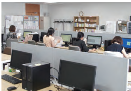
臨床心理学専攻研修室の様子

カリキュラムは、公認心理師と臨床心理士を育成するための必修科目と本専攻を修了するために必要な修士論文指導の科目構成としています。臨床心理士養成科目（コア科目・A～E群）には、臨床心理学研究法、精神医学、心理療法の関連科目などがあり、保健・医療・福祉のみならず、教育の分野など、さまざまな分野を目指すための科目が充実しています。多様かつ高度の専門性を有した教員が臨床心理学専攻の講義、演習、研究指導にあたり、多方面からの指導が受けられる充実した教育環境といえます。