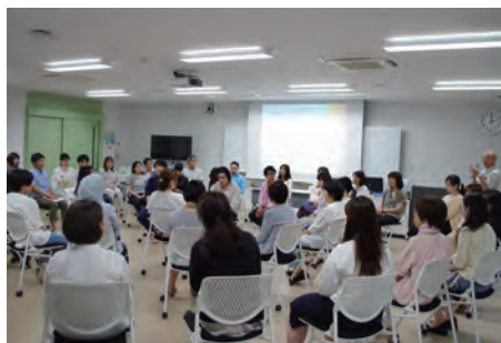
専任教員・大学院生が合同で行う総合カンファレンスの様子

保健・医療・福祉の領域は人間のこころと深くかかわる領域でもあります。高度な専門性と学術性、学際性、豊かな人間性の備わった、現場で役立つ専門職を育てたいということを基本に置いています。臨床心理学専攻では、他分野の専門職と協働して保健・医療・福祉に貢献し、現代社会のニーズに応えることができる高度専門職業人としての公認心理師・臨床心理士を育てます。そのため、本専攻では保健・医療・福祉の専門職の人や、心理系の学部学科卒業生、一般の大学の卒業生、一般の職業経験のある社会人など、幅広い分野から学生を募集しています。