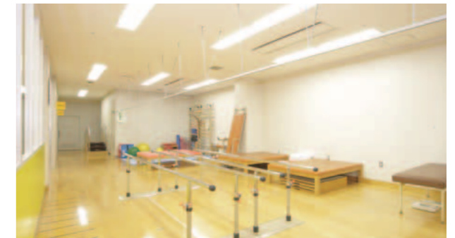
リハビリテーション室