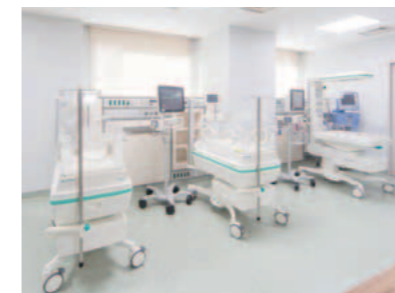
NICU(新生児集中治療室)