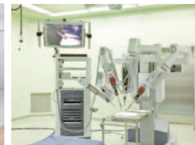
手術支援ロボット「ダ・ヴィンチ」