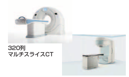
320列マルチスライスCT