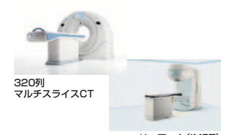
320列マルチスライスCT