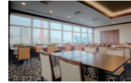
レストランオーブ