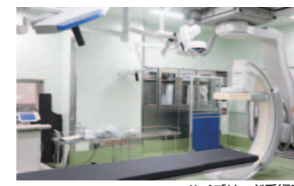
ハイブリッド手術室