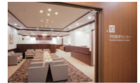
予防医学センター