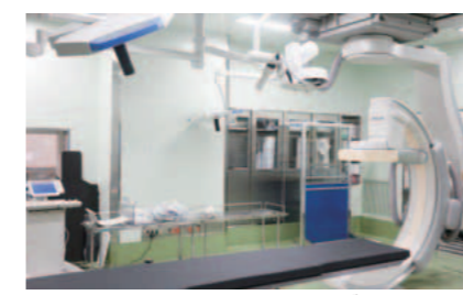
ハイブリッド手術室