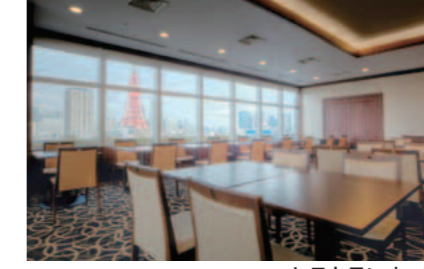
レストランオーブ