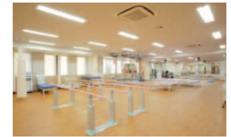
リハビリテーションセンター