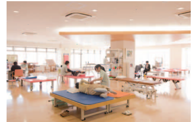
リハビリテーションセンター