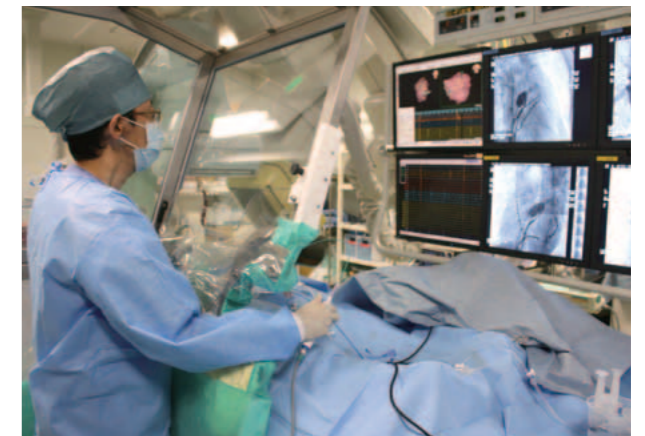
ハートリズムセンター