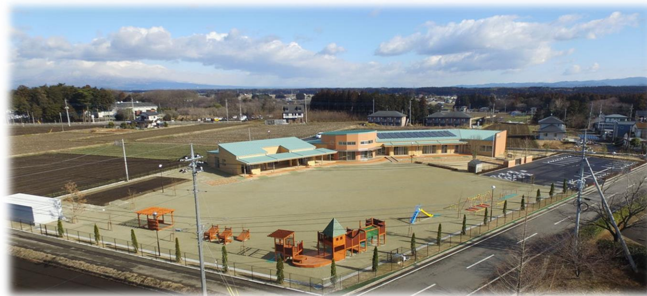
【金丸こども園全景】

これらの取り組みに積極的に取り組むことにより、地域の皆さまに愛され、親しまれる施設になるよう精一杯努力してまいりますので、ご理解とご協力を賜りますようお願い申し上げます。