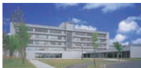
大田原キャンパス