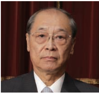
分野責任者 国際医療福祉大学大学院 席副大学院長