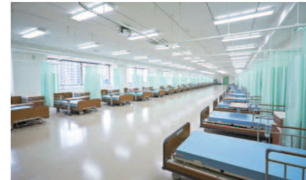
ナーシングスキル・ラボ