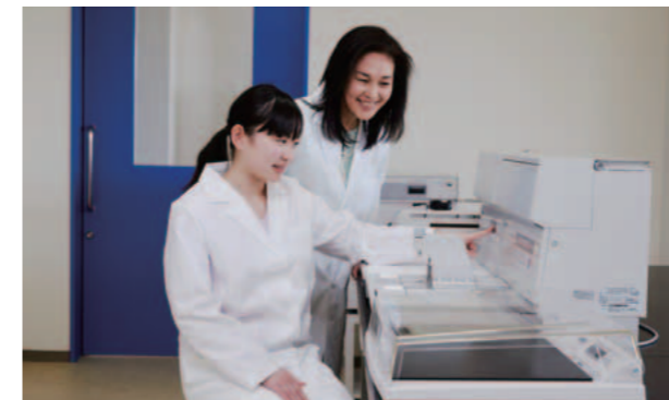
形態系・定量系実習室