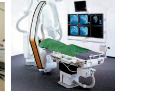
胸部用血管造影(アンギオ)装置

約90年の歴史を誇る国立熱海病院を2002年(平成14年)に承継し、国際医療福祉大学で初めての附属病院として開設しました。2005年(平成17年)の新病院完成後、高い専門技術を持つ医療スタッフを配置し、PET-CTや64列マルチスライスCT、胸部用血管造影(アンギオ)装置など先端医療機器を整備したほか、遠隔画像診断を行うPACSを導入し、がんに対する化学療法を行うなど、地域基幹病院としての機能を充実させています。また、豊かな自然と温泉に恵まれた熱海の特長を最大限に生かし、開放感にあふれた快適な療養環境を実現しています。2016年(平成28年)4月には、静岡県の地域がん診療病院となりました。臨床研修指定病院として、若手医師育成にも力を注ぎながら、熱海・伊東・湯河原地域の中核病院として、各医科大学や地元医療機関と連携を図りながら、良質で高度な医療をご提供しています。