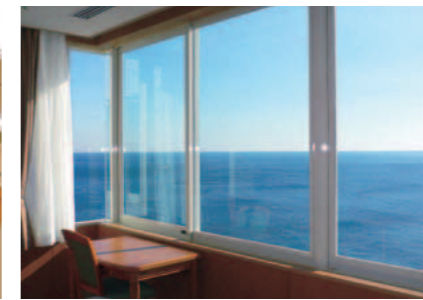
病室窓外に広がる相模湾