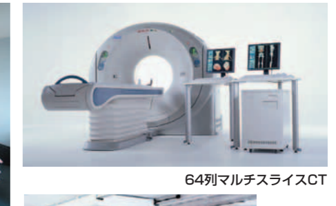
64列マルチスライスCT